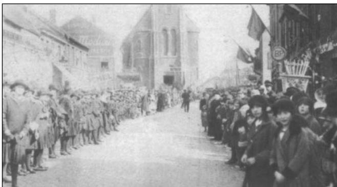
De enthousiaste menigte wacht op de komst van de vorstin. Let op de schoolmeisjes rechts op de foto, onder het wakend oog van de zuster. Midden op de straat bemerken we de fotograaf met zijn omvangrijk fototoestel en statief die zich klaar zet om alles vast te leggen voor het nageslacht.