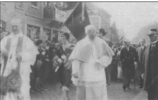
Koningin Elisabeth op weg naar de kerk van Jezus-Eik voorafgegaan door de geestelijken.

De kerk van Jezus-Eik heeft indertijd grootse dagen meemaakt. Een van die hoogdagen was zeker en vast de wijding van de tien glasramen. Op dinsdag 26 april 1928 hebben koningin Elisabeth en prinses Marie José de wijding bijgewoond. Dit feest