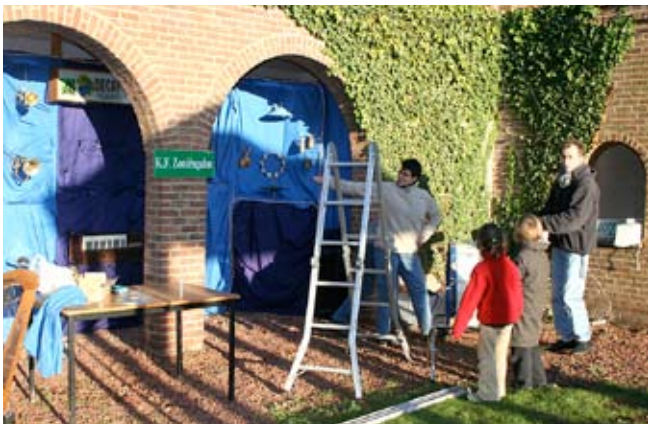
Het "levend Decaporgel" van de fanfare in opbouw

Dit was Jezus-Eik op z'n best. De vijftig jaar oude traditie van het "Prochefiest" zal volgend jaar zeker worden voortgezet.